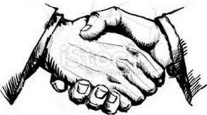
ኣባ ኣጉሰቲኖ ኣብ መንጎ ኤርትራውያን ዘይሕለል ናይ ሰላምን ዕርቅን ስራሕ ዘካየዱ ሰብ ነበሩ