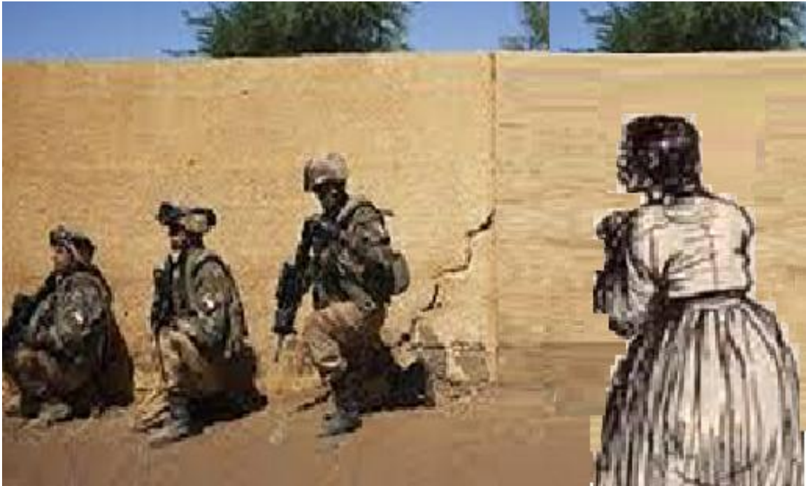
ንጸላኢ ኢድካ ሂብካ ንብጻትካን ሓገዝትኻን ኣብ ሽግር ምእታው ሓደ ኣብ ባህልና ዘይነበረ ንሃገር ጎዳኢ ዝኾነ ስራሕ እዩ