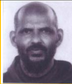
አባ አጉስቲኖ ተድላ