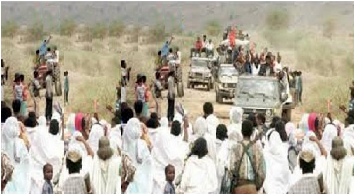
ውግእ ሓድሕድ ደው ክብል ጠለብ ናይ ህዝቢ እዩ ነይሩ። ከይፈርህ ድማ ድልዎቲ ንክልትኤን ዉድባት ይገልጽ ነይሩ።