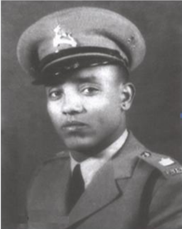
ጀነራል ተድላ ዑቀቢጉ