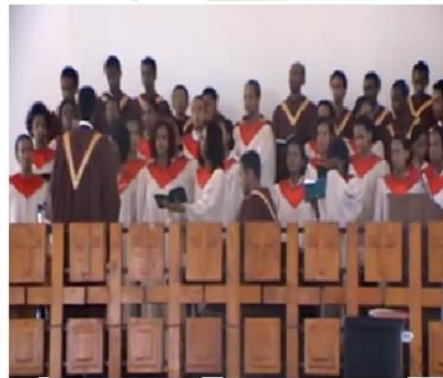
መዘሙራን መንእሰያት ኣብ ቤተክርስቲያን ከዝምሩ ከለዉ