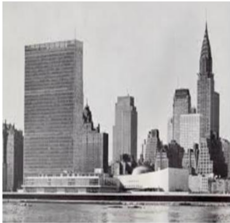
ቤተጽሕፈት ሕቡራት ሃገራት ኣብ ንዩዮርክ