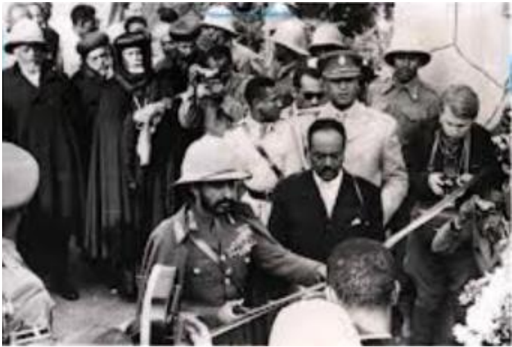
እዚ ስእሊ ንጉሰ ሃይለስላሴ ንመጀመርታ ግዜ ናብ ሃገረ ኤርትራ ዝኣተወሉ ዘርኢ እዩ።

ኣብ መጋቢት 1958፡ ዝተፈለለ ማሕበራት ሰራሕተኛታት ኤርትራ መሰላተን ክሓታን ኣንጻር፡፡፡ መንግስቲ ሃይለስላሴ፡ ፈደረሽን ኤርትራን ኢትዮጵያን ኣፍሪካ ኤርትራ ምስ ኢትዮጵያ ክትሓብር ዝገብር ዝነበረ ውዲት ንምምካት ናይ ስራሕ ደው ምባል ኣድማ ኣካዪደን ነይረን። እቲ ተቃውሞ እናሰፍሐን እናበርትዐን ምስ ከደ ተመሃሮን ወንጌቲ ትካላትን ተሓወሱዎ። ከም ሳዕቤን ድማ ከተማ ኣስመራ ካብ ኩሉ ምንቅስቓስ ተሓሪማ ደው ከም ትብል ኮነት። እቲ ስራሕ ደው ምባልን ተቃውሞን ካብ ኣስመራ ሓሊፉ ናብ ባጽዕ፡ ከረን፡ ደቀምሓረ ዝኣመሰላ ዓበይቲ ከተማታት ኣስፋሕፍሐ።