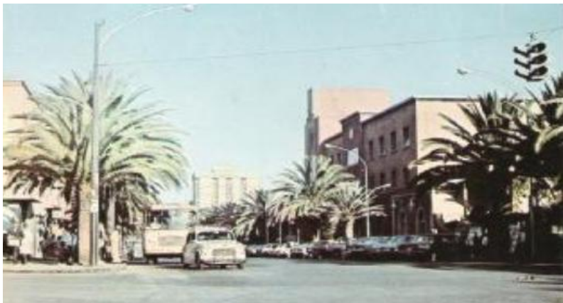
ኣብ 1960 ዝተወሰደ ሰለሊ ህንጻ ባይሩ ኤርትራ

ካብ 1955-1956 ኣትሒዞ ብሰራሕተኛታትን ተመሃሮን ዝተወደበ ኣንጻር መንግስቲ ዝቐንዐ ተቐውሞን ሰላማዊ ሰልፍን ምስ በዝሐ፡ ንተቐውሞቲ ንምርዓድ ተባሂሉ ባይሩ ኤርትራ ንመራሕ መንግስቲ ቢተወደድ ኣስፋሃ ወልደሚካኤል ኣርቲኮሎ ዴቺ እትብል ዓንቀጽ ከጽድቅ ኣፍቀደሉ። ባይሩ ኤርትራ ኣብዚ እዋን ምፍቃዱ፡ መንግስቲ ኢትዮጵያ ኣብ ውሸጢ ባይሩ ኤርትራ ድሮ ጽልዋኡ ከሕይል ከም ዝጀመረ ዘመልከት ተርእዮ እዩ ነይሩ።