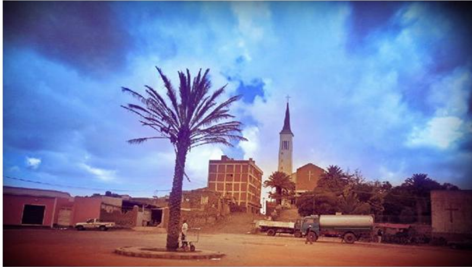
ወንጌላዊት ቤተክርስቲያን ኤርትራ ኣብ ዝ ከኒሻ ኣስመራ (ናይ ቀደም ስኢሊ)