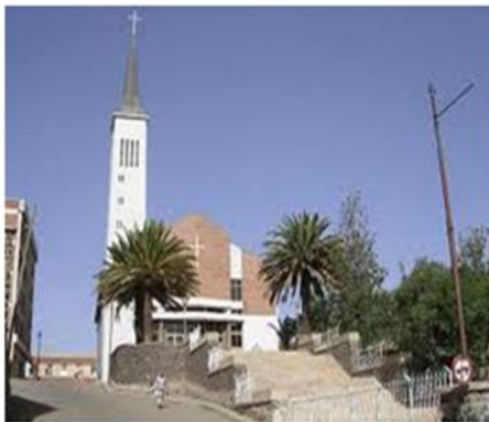
ወንጌላዊት ቤተክርስቲያን ኤርትራ ኣብ ዝ ከኒሻ ኣስመራ። (ናይ ቀረባ ግዜ ስኢሊ)