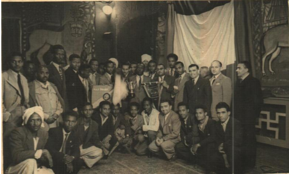
ተስፋዝጊ ካብዞም ኮፍ ኢሎም ዘለዉ እቲ ካልኣይ ብዮማን ዘሎ እዩ። እቲ ቦታን ፣ ግዝዮን ፣ አሰማት ናይቶም ካልኣትን ክፍለጥ ኣይተኸእለን። ዝፈልጥ ሰብ እንተ'ልዩ ክሕብረኒ እምሕጻን።

እንተኾነ ተስፋዝጊ ብብዙሕ ወገናቱ ፍሉይ ሰብ ስለ ዝነበረ፡ አሰራሩ ክነሱ ኣብቲ ናይ ሰራሕተኛታት ናዕቢ ዓቢ ተራ ከም ዝነበሮ ንርኢ። እቲ ኣብ 1958 ዝነበረ ናይ ሰራሕተኛታት ናዕቢ ኣብ ኣጀማምራኡን መልከውን ብማሕበር ሰራሕተኛታት ነይሩምበር ዝተፈላለዩ ተሳተፍቲ እዮም ነይሮም። እቲ ቀንዲ ዕላማ ናይቲ ናዕቢ ኣንጻር'ቲ ንጉስ ሃይለስላሴ ዝገብሮ ዝነበረ ምፍራስ ፈደረሽን፡ ብኡ ጌርካ ድማ ንኤርትራ ምስ ኢትዮጵያ ምጽንባር ዝዓለመ ምንባሩ ንጹር ነይሩ። ካብቶም ተሳተፍቲ ከጥቀሱ ዝኸለሉ ዝተፈላለዩ ጉጅለታት መንእሰያትን ተመሃሮን ነጋዶን ከምዝነበሩ ናይ ታሪኽ ጽሑፋት ይሕብሩና። ተስፋዝጊ ካልእ መዳያት ናይ መቃለሲ ኣይምሰኣነን ነይሩ። እንተኾነ ነቲ ተቐውሞ ከደልድሎ ዝኸለል በቲ ተጠርኒፉ ዝነበረ ማሕበር ሰራሕተኛታት ኮይኑ ስለ ዝረአዮ ከኸውን ይኸእል ኢልካ ንምግማት ይከኣል። ብተወሳኺ እቲ ዝነበሮ ውዕወዕ ፍቕሪ ሃገርን ኣብ ፈጣሪኡ ዝነበሮ ድልዳል እምነትን ኣብ ዝኾነ ኣትዩ ከቃለስ ጸገም ኣይነበሮን። ተስፋዝጊ ብኸሉ ወገናቱ ፍሉይ ሰብ ከም ዝነበረ ንምርዳእ ዘጸግም ኣይኮነን።