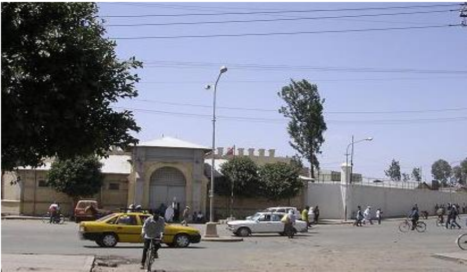
ማእከላይ ገበን መርመራ (ቼንትሮ) ንተስፋ-ዝጊ ካልኣይ ገዝኡ ዝነበረ።